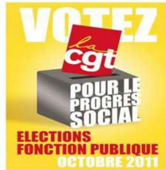
Manifestation de soutien aux travailleurs sans-papiers le 5 avril 2008 - Affiche de la CGT pour les élections des délégués du personnel dans la fonction publique (octobre 2011)