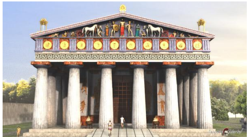
Temple de Zeus à Olympie

L'ordre dorique: les chapiteaux sont simples et les fûts des colonnes sont larges. L'ordre ionique: les chapiteaux forment des volutes et les fûts des colonnes sont plus étroits. L'ordre Corinthien: les chapiteaux sont plus décorés et les fûts des colonnes sont étroits. Il apparaît plus tard et sera utilisé par les romains.