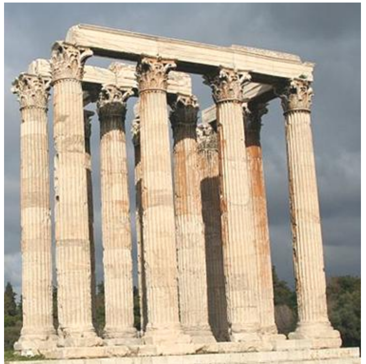
Temple de Zeus à Athènes