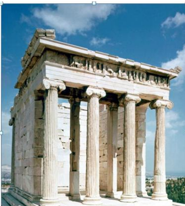
Temple d'Athéna Niké à Athènes