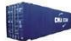
High cube palletwide Containers