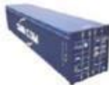
Open top Containers