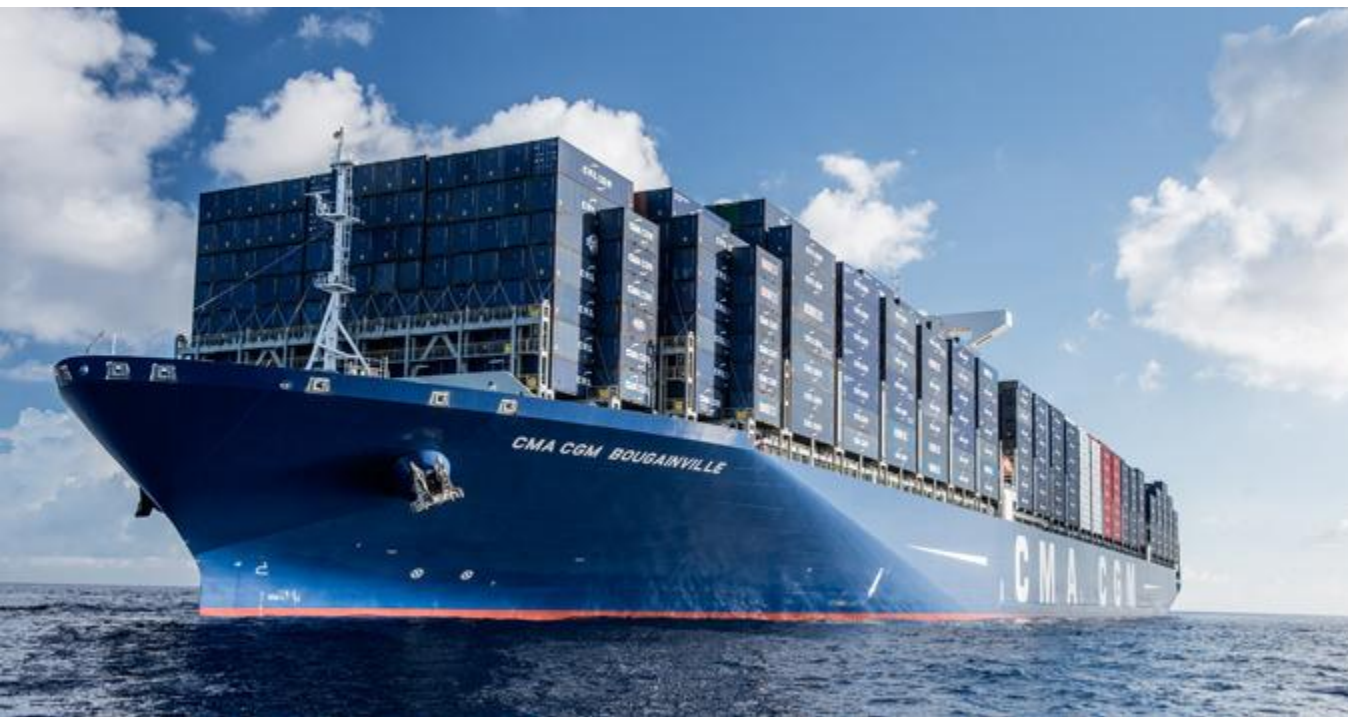
Site CMA CGM