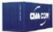
General purpose containers