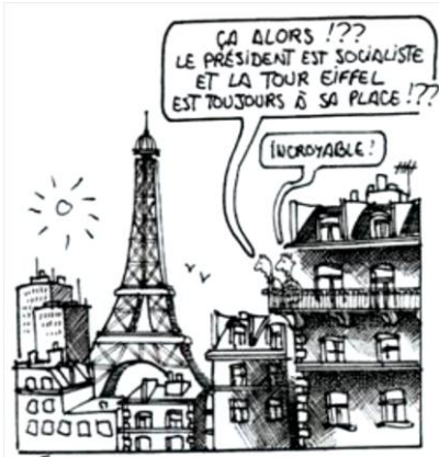
2 « Incroyable ! » Caricature de Plantu publiée dans Le Monde , 11 mai 1981.