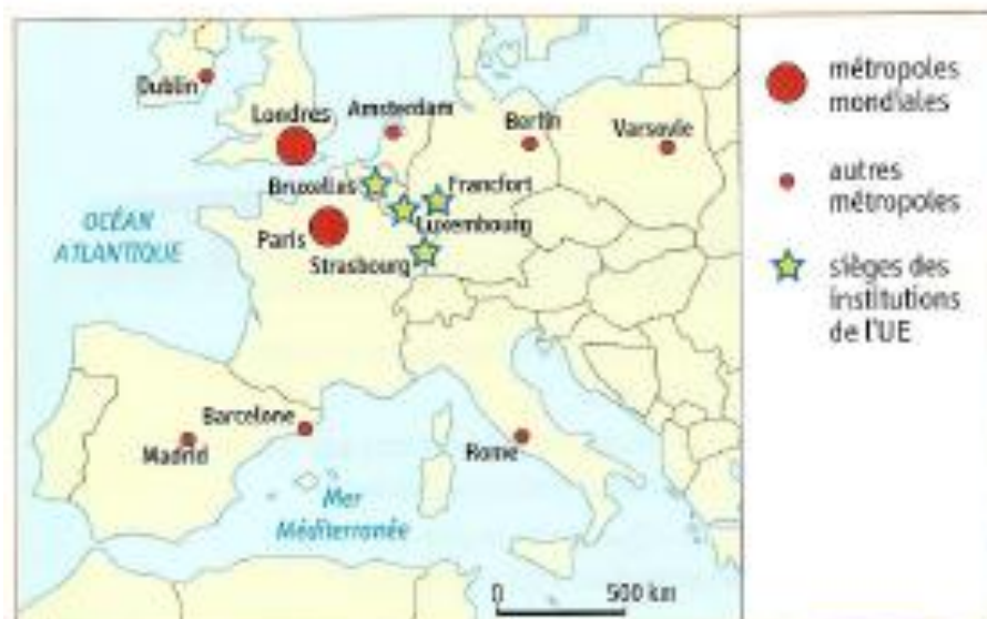
3 Les métropoles de l'UE